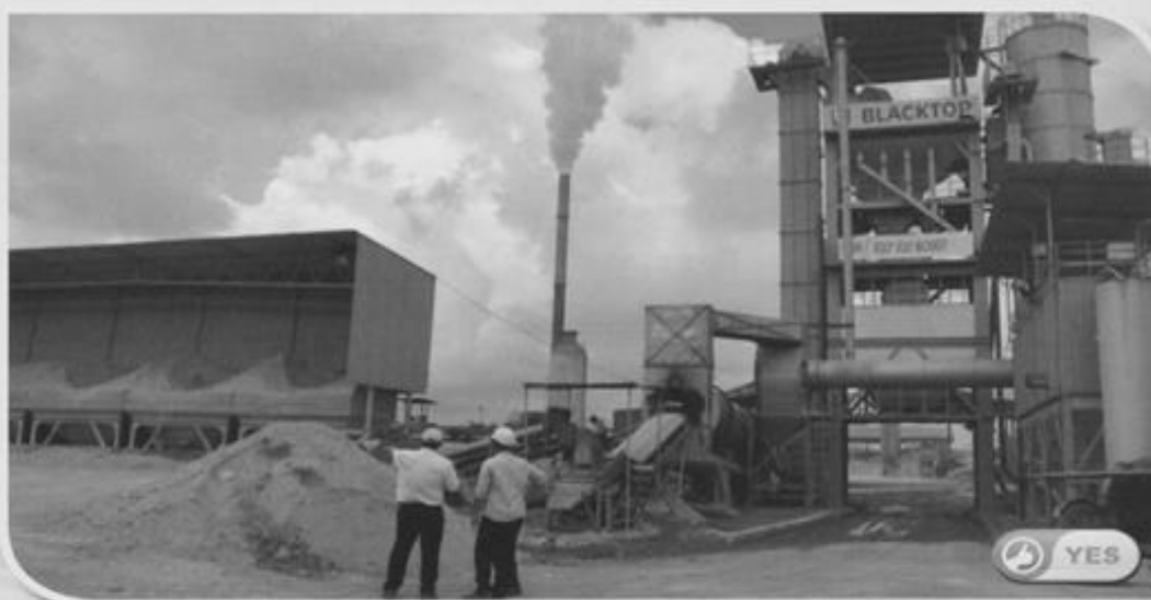
KUARI BLACKTOP INDUSTRIES SDN BHD DI SALAK TINGGI, SEPANG

SENARAI KUARI YANG DIKTIKRAF OLEH JKR MALAYSIA DI SELANGOR