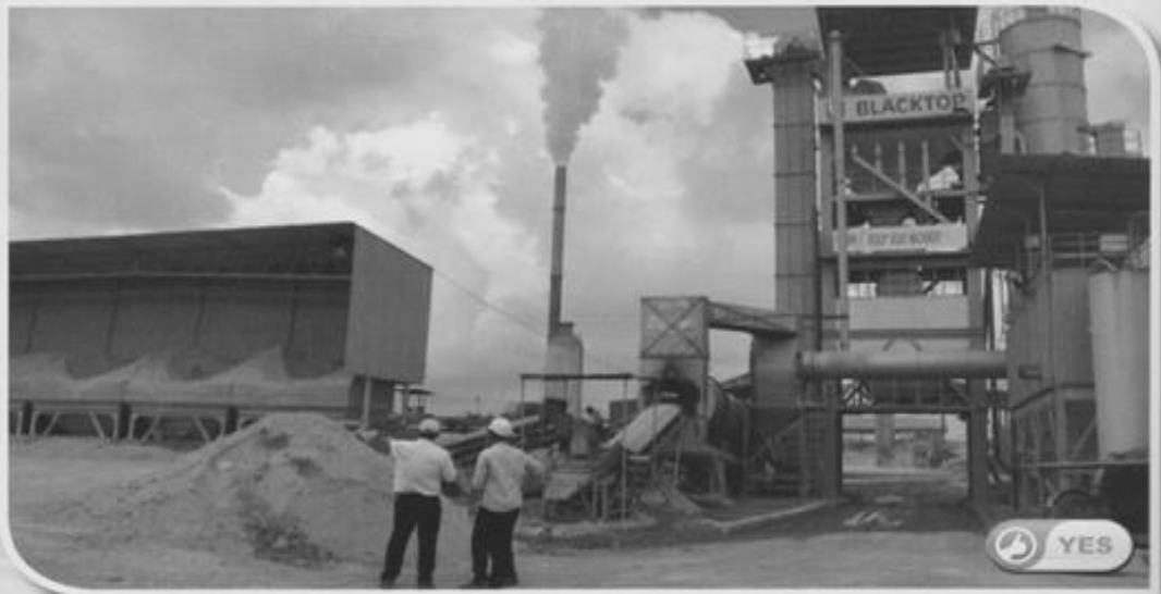
KUARI BLACKTOP INDUSTRIES SDN BHD DI SALAK TINGGI, SEPANG