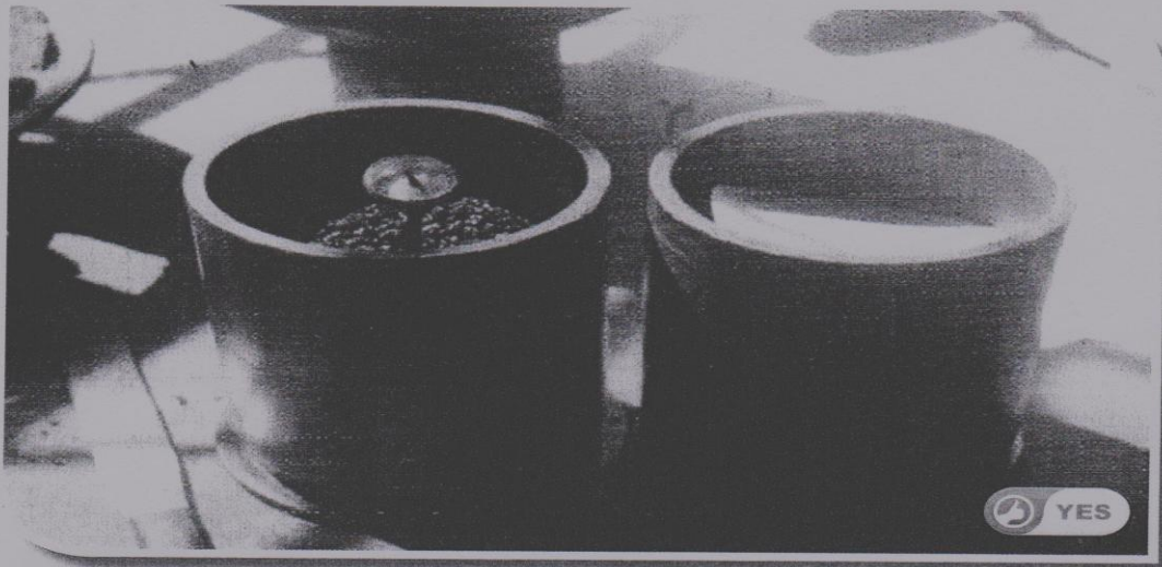
REKABENTUK PREMIX MENGIKUT SPESIFIKASI JKR